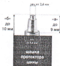
Схема требования к шипам заднего колеса для классов Спорт МХ-1, Спорт МХ-2, Китайский класс