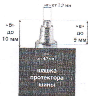
Схема требования к шипам заднего и переднего колес для классов Орел МХ-1, Орел МХ-2, «125 куб. см» Женский класс

6.3. Классы «Китайский класс» - к соревнованиям допускаются шины, шипованные стандартным кроссовым шипом параметрами: